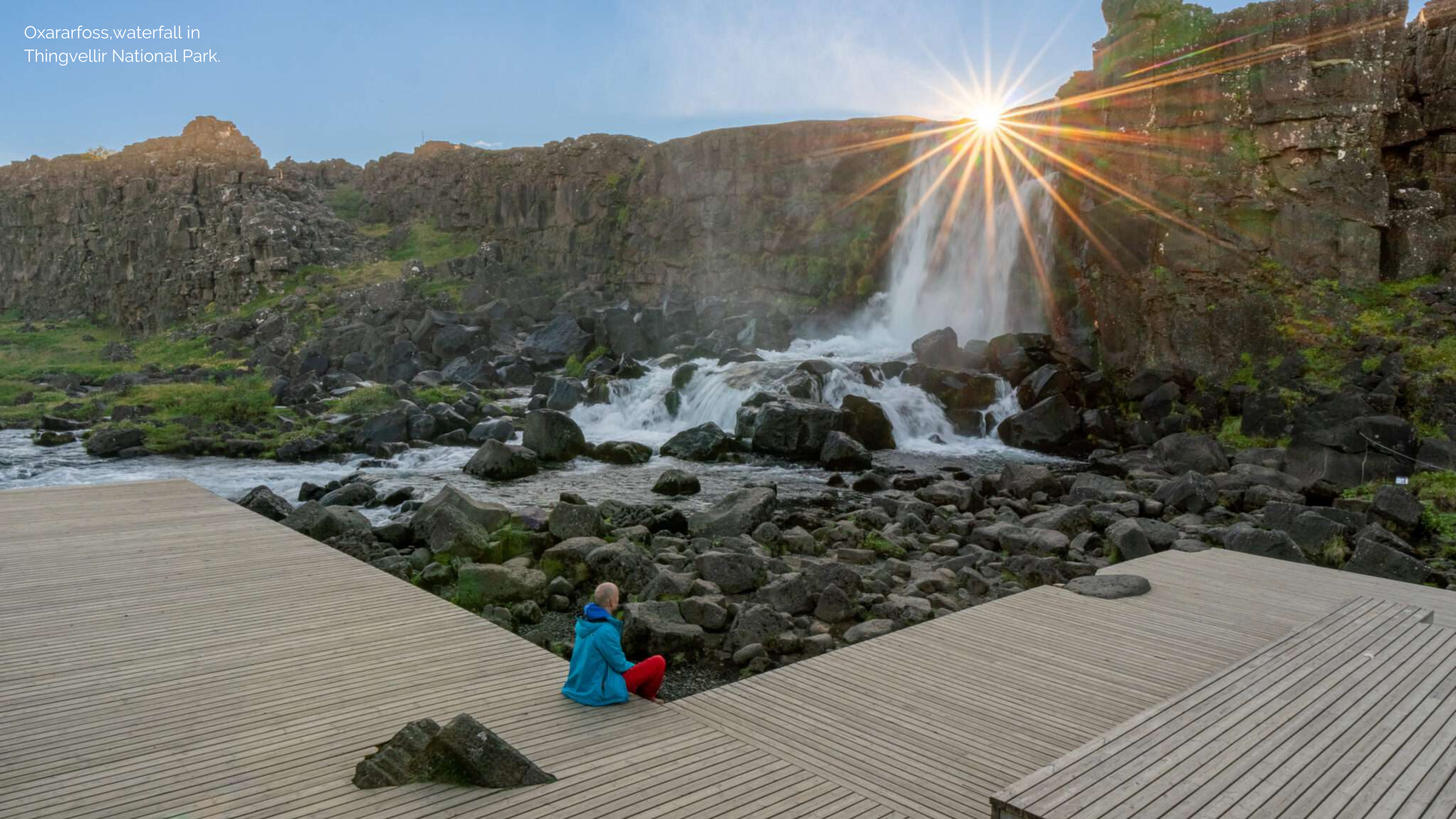
Oxarafoss, waterfall in Thingvellir National Park.